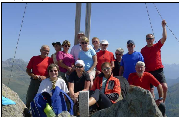
Deferegger Pfannhorn (2.820 m)